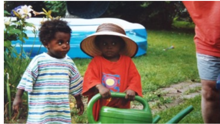
Det er mig og min søster med 2 år.